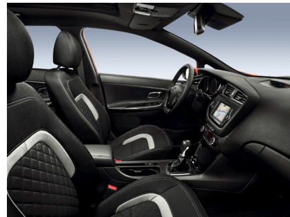
Svart, quiltad sporttygklädsel med grå kontrast-sömmar och svarta piano-lackerade interiördetaljer (GT Line)