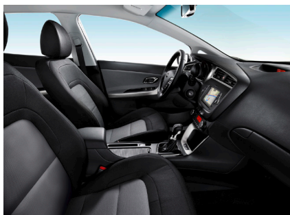
Svart / grå tygklädsel med silvermetall-effekt på instrumentbrädan och dörr-handtag (1,4 Special Edition)