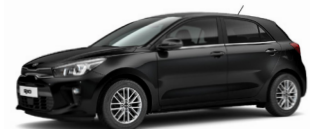
Aurora Black Pearl (ABP) metallic (pearleffekt)

Kia Motors Sweden AB Kanalvägen 10A 194 61 Upplands Väsby Sverige Tfn: 08 - 400 443 00 www.kia.com