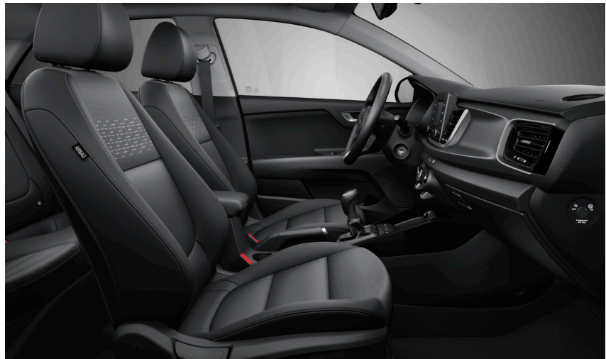
Svart interiör med svart tygklädsel.