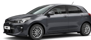
Platinum Graphite (ABT) metallic (pearleffekt)