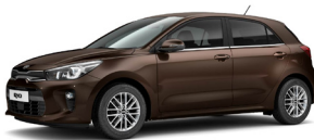
Deep Sienna Brown (SEN) metallic (pearleffekt)