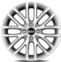
16" aluminiumfälg (Advance)