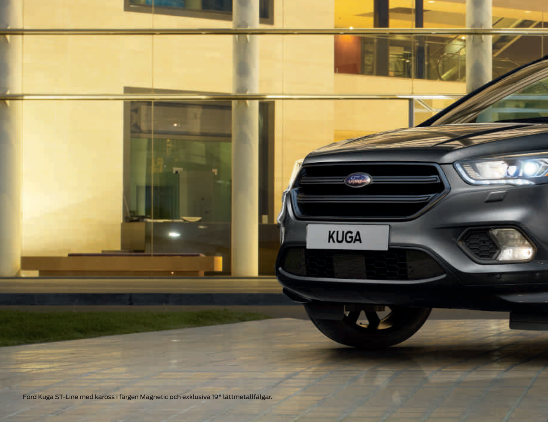
Ford Kuga ST-Line med kaross i färgen Magnetic och exklusiva 19" lättmetallfälgar.