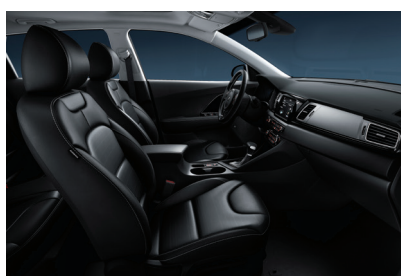
Saturn Black (std. PlusPaket 1) Svart delläder, paneler i svart pianolack