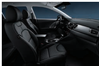
Saturn Black (std. Advance) Svart tyg, paneler i svart pianolack