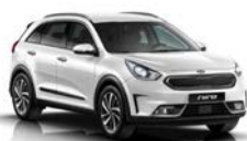
Snow White Pearl (SWP) metallic (pearleffekt)