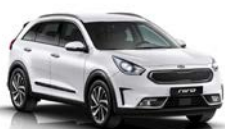
Clear White (UD) solid