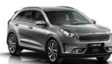
Metal Stream (MST) metallic