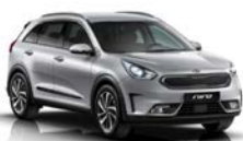
Silky Silver (4SS) metallic