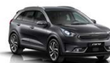
Platinum Graphite (ABT) metallic