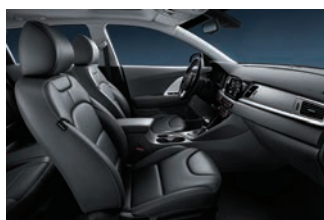
Smokey Grey (Tillval PlusPaket1) Grått delläder, paneler i vit pianolack