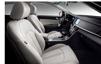
Vit läderklädsel (tillval)