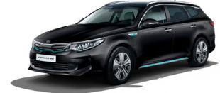
Aurora Black Pearl (ABP) metallic (pearleffekt)

Kia Motors Sweden AB Kanalvägen 10A 194 61 Upplands Väsby Sverige Tfn: 08 - 400 443 00 www.kia.com