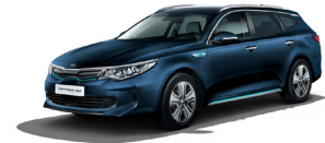
Gravity Blue [B4U] metallic