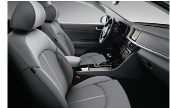
Grå läderklädsel (tillval)