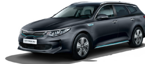
Platinum Graphite (ABT) metallic