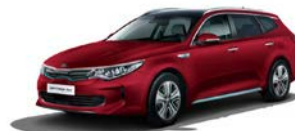
Temptation Red (K3R) metallic