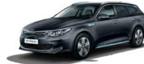
Platinum Graphite (ABT) metallic