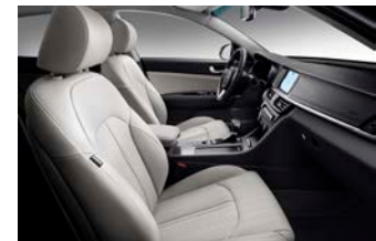
Vit läderklädsel (tillval)