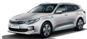
Silky Silver (4SS) metallic