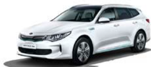
Clear White (UD) solid