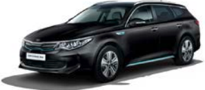
Aurora Black Pearl (ABP) metallic (pearleffekt)

Kia Motors Sweden AB Kanalvägen 10A 194 61 Upplands Väsby Sverige Tfn: 08 - 400 443 00 www.kia.com