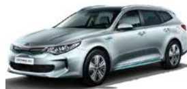
Aluminium Silver (C3S) metallic