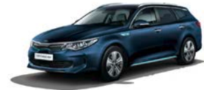
Gravity Blue [B4U] metallic