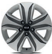
17 " aluminiumfälg