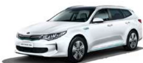
Snow White Pearl (SWP) metallic (pearleffekt)