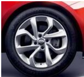
RRZ (16" lättmetall)