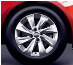
RRK (15" lättmetall)