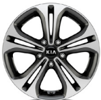
17 " aluminiumfälg