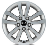
16 " aluminiumfälg