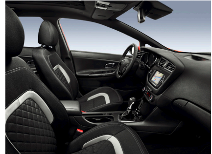
Svart, quiltad sporttygklädsel med grå kontrast-sömmar och svarta piano-lackerade interiördetaljer (GT Line)