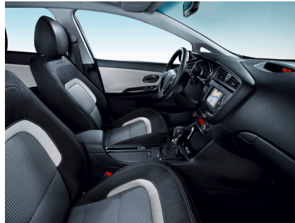
Svart tygklädsel med svarta piano lackerade interiördetaljer (Advance)