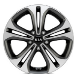
17 " aluminiumfälg