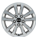
16 " aluminiumfälg