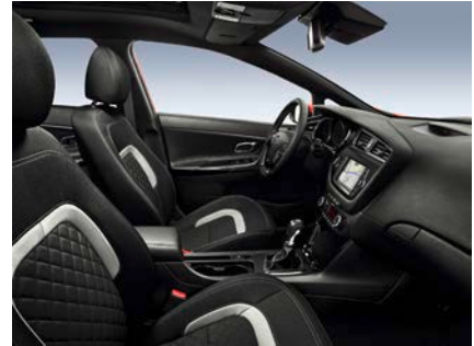
Svart, quiltad sporttygklädsel med grå kontrast-sömmar och svarta piano-lackerade interiördetaljer (GT Line)