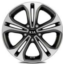
17 " aluminiumfälg