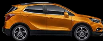
Burning Hot Orange