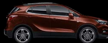
Deep Espresso Brown