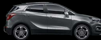
Satin Steel Grey