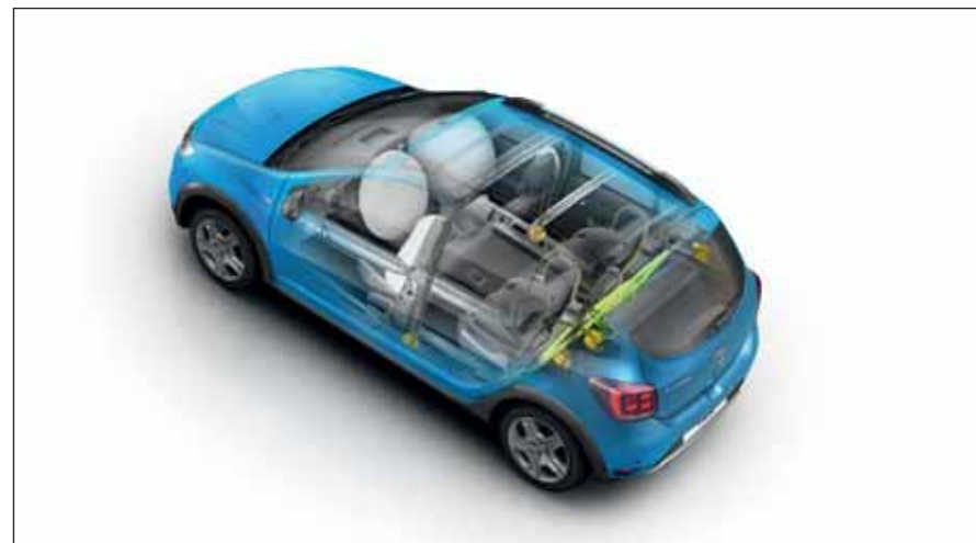
Skydd : Förstärkt kaross, krockkuddar fram och på sidan framtill, Isofix-fästen på sidoplatserna i baksätet.