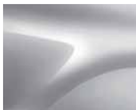
GRÅ HIGHLAND (KOA) (2)