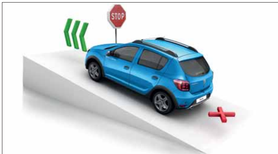
Starthjälp i backe : Systemet ger dig extra tid att komma iväg, utan att du behöver oroa dig för att rulla baklänges.

antisladdsystem (ESC) och antispinnsystem (ASR) för ökad stabilitet och effektiv bromsning i alla lägen. Här finns också krockkuddar fram och på sidan, Isofix-fästen för barnstol på de båda sidoplatserna bak, starthjälp i backe och parkeringsradar bak. Det ska kännas tryggt att ge sig ut på vägen!