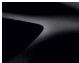
NATTSVART (676) (2)