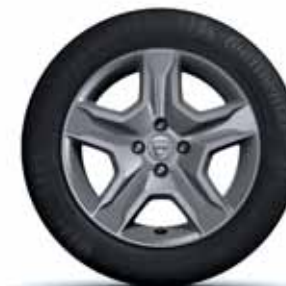
16" FLEXWHEEL "BAYADERE" MÖRKGRÅ METALLIC