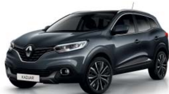
Grå "Titanium" (M)