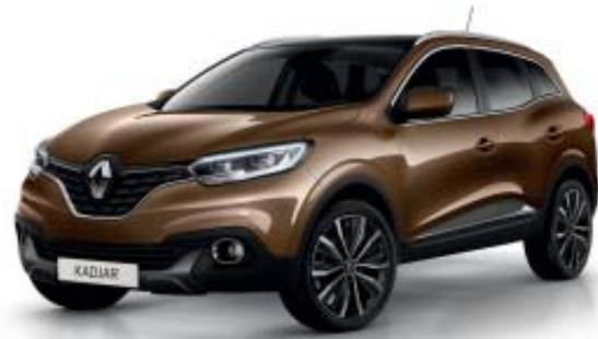
Brun "Cappuccino" (M)