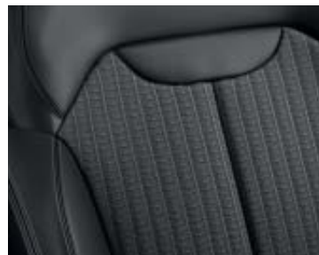
Klädsel i konstläder och Bose-specifik textil