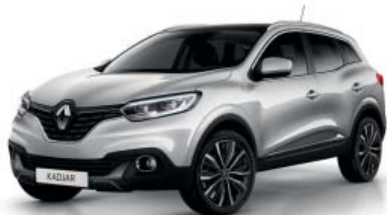
Grå "Platine" (M)