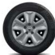
16" hjulsida Pragma