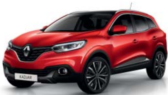
Röd "Flame" (M)