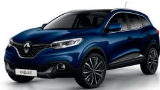
Blå "Cosmos" (M)