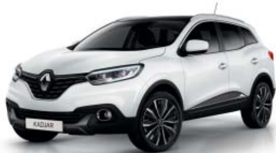
Vit "Glacier" (S)