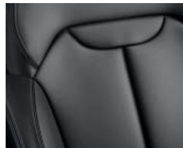
Svart läderklädsel (tillval)