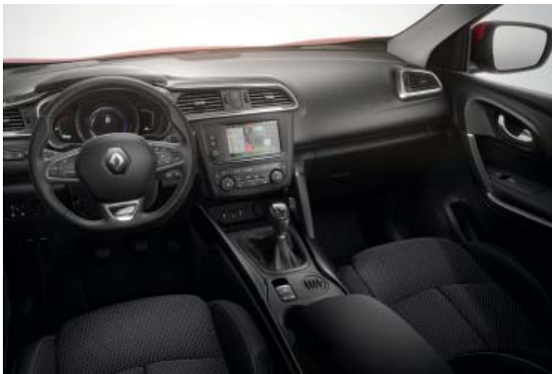
Bild till Pack R-LINK 2