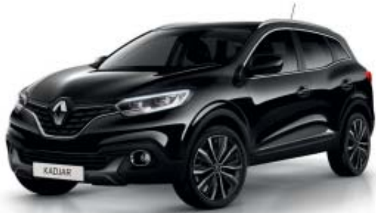
Svart "Étoilé" (M)