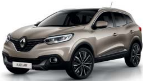
Beige "Dune" (M)