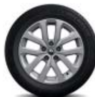
17" Aluminiumfälg Aquila