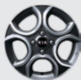
15" aluminiumfälg, 175/50R Tillvalspaket