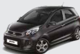
Z1_Midnight Black (Metallic)