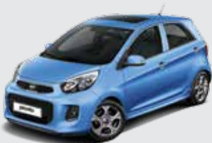
ABB_Alice Blue (Solid)