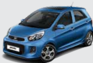
BU7_Dazzling Blue (Metallic)