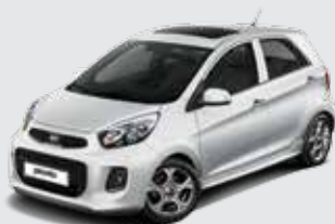
UD_Clear White (Solid)