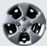
14" stålfälg, 165/60R Standard