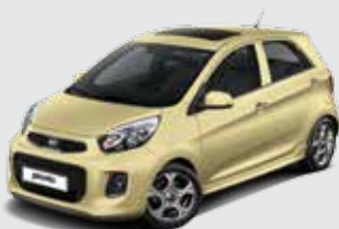
M9Y_Milky Beige (Metallic)