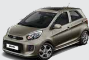
IM_Titanium Silver (Metallic)