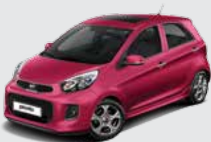
K1P_Cherry Pink (Metallic)