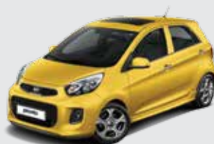
B2Y_Honey Bee (Metallic)