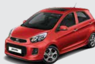
BEG_Signal Red (Metallic)