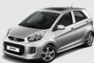
3D_Bright Silver (Metallic)