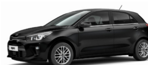
Aurora Black Pearl (ABP) metallic (pearleffekt)

Kia Motors Sweden AB Kanalvägen 12 194 61 Upplands Väsby Sverige Tfn: 08 - 400 443 00 www.kia.com