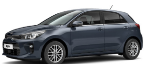
Smoke Blue (EU3) metallic (pearleffekt)