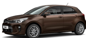
Deep Sienna Brown (SEN) metallic (pearleffekt)