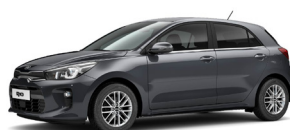
Platinum Graphite (ABT) metallic (pearleffekt)