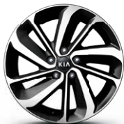
18" Aluminiumfälgar (Tillval)