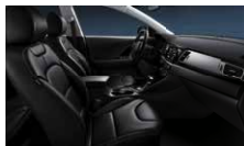
Saturn Black (std. PlusPaket 2) Svart läder, paneler i svart pianolack