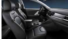
Smokey Grey (Tillval PlusPaket 1) Grått delläder, paneler i vit pianolack