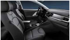
Smokey Grey (Tillval Komfort) Grå tyg, paneler i vit pianolack