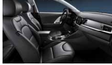
Smokey Grey (Tillval PlusPaket 2) Grått läder, paneler i vit pianolack