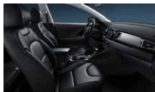
Saturn Black (std. PlusPaket 1) Svart delläder, paneler i svart pianolack