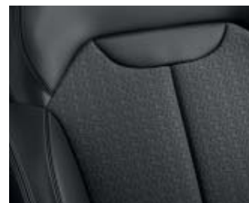
Klädsel i konstläder och titansvart textil (tillval med Lastpaket)