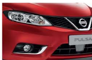
Red - S - Z10