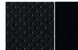
TEKNA - MOCKALIKNANDE TYG