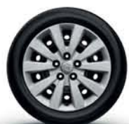
16" stålfälgar med navkapsel