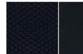
N-CONNECTA - DELLÄDERINREDNING