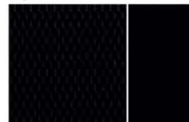
VISIA - MÖNSTRAT TRIKÅTYG