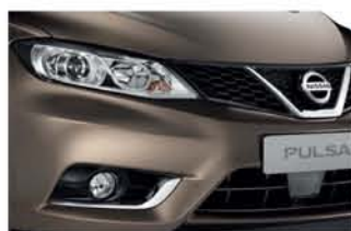
Bronze - M - CAP