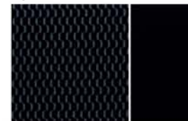
ACENTA - MÖNSTRAT TRIKÅTYG