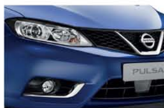
Azure - M - RBR