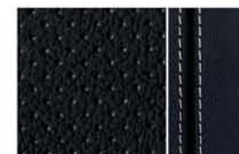
TEKNA R - LÄDER MED VIT STICKNING