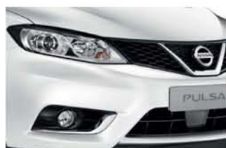
White Pearl - P - QAB