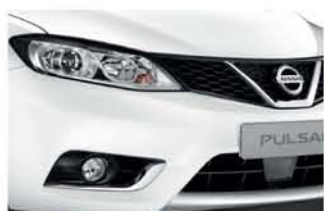
White - S - QM1