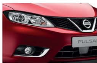
Force Red - M - NAH