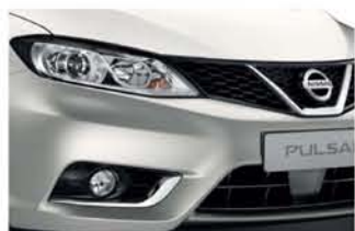
Silver - M - KL0