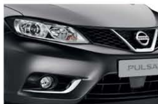
Grey - M - K51