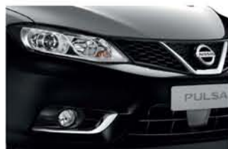
Black - M - GN0