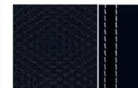
N-CONNECTA R - DELLÄDER MED VIT STICKNING